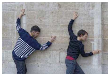
Répétitions Jardin du Palais Royal Octobre 16